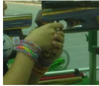
FIGURE 4 : POSITION DES MAINS INTERDITE