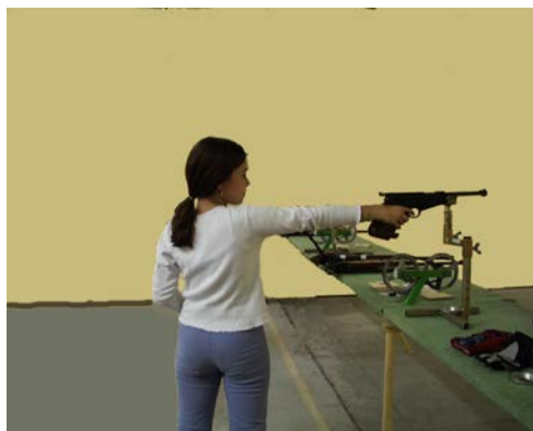
FIGURE 3 : POSITION DE L'ATHLETE PISTOLET