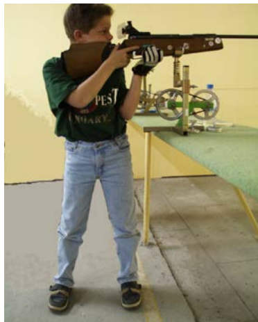
FIGURE 2 : POSITION DE L'ATHLETE CARABINE